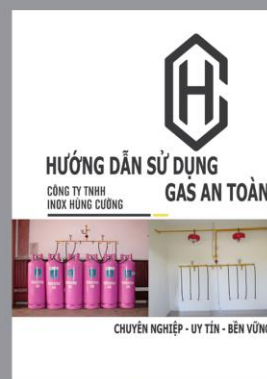
Hướng dẫn sử dụng Gas an toàn