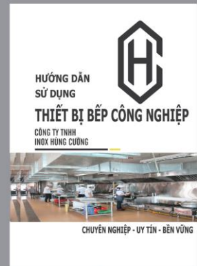
Hướng dẫn sử dụng Thiết bị Bếp công nghiệp