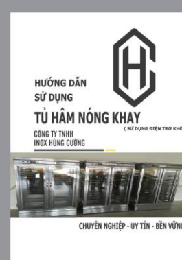
Hướng dẫn sử dụng Tủ hâm nóng khay