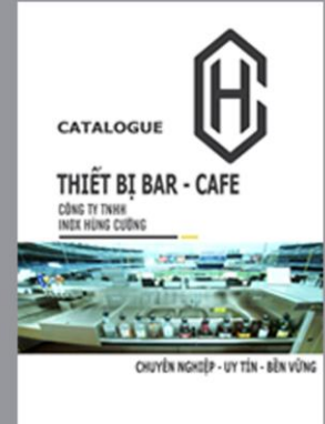
Catalogue Thiết bị Bar - Cafe