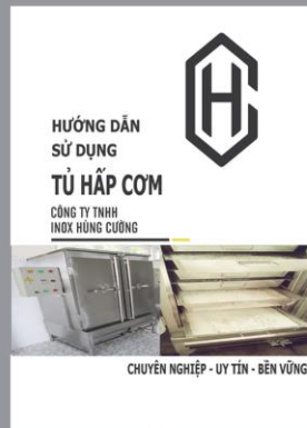
Hướng dẫn sử dụng Tủ hấp cơm