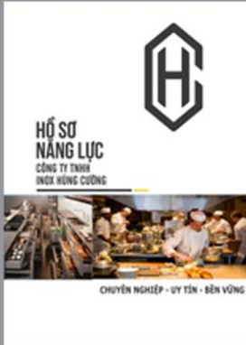
Hồ sơ năng lực