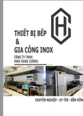
Catalogue Thiết bị Bếp