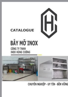
Catalogue Bẫy mỡ Inox