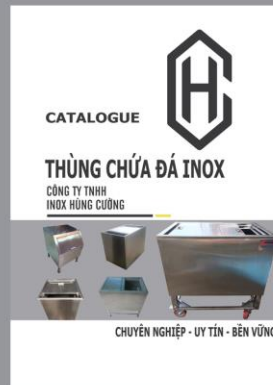
Catalogue Thùng chứa đá Inox