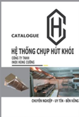
Catalogue Hệ thống hút khói