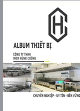
Album Thiết bị